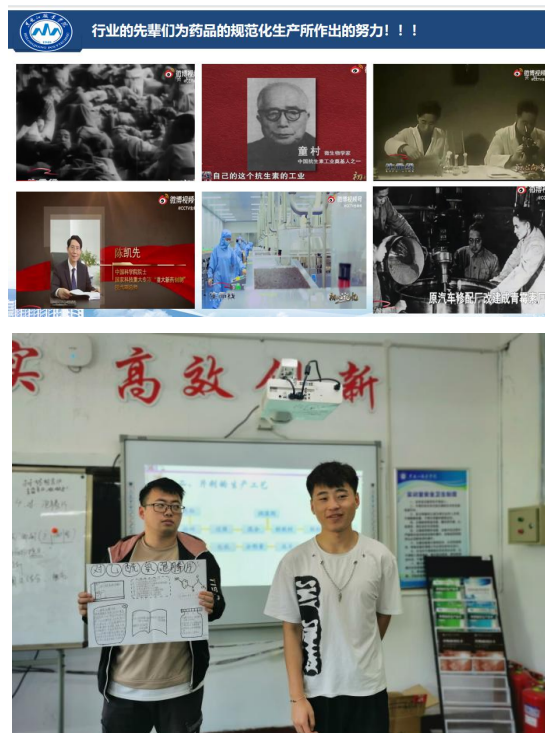
图3 学生汇报设计方案，强化家国情怀

的中国梦，是前辈们刻苦钻研、严谨治学所获得的成果，培养学生家国情怀，法治观念和精益求精的工匠精神。